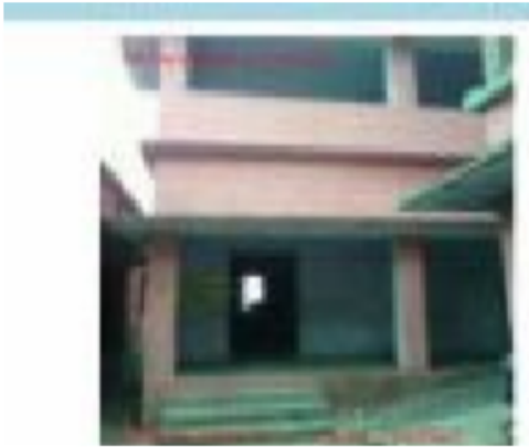
Polling Station Front View